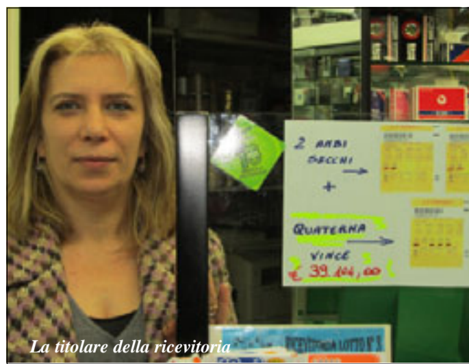
La titolare della ricevitoria

abilità. Almeno stando a quello che hanno detto i titolari della ricevitoria che dicono di conoscere il fortunato vincitore, ma non 'scuciono' una parola sul-